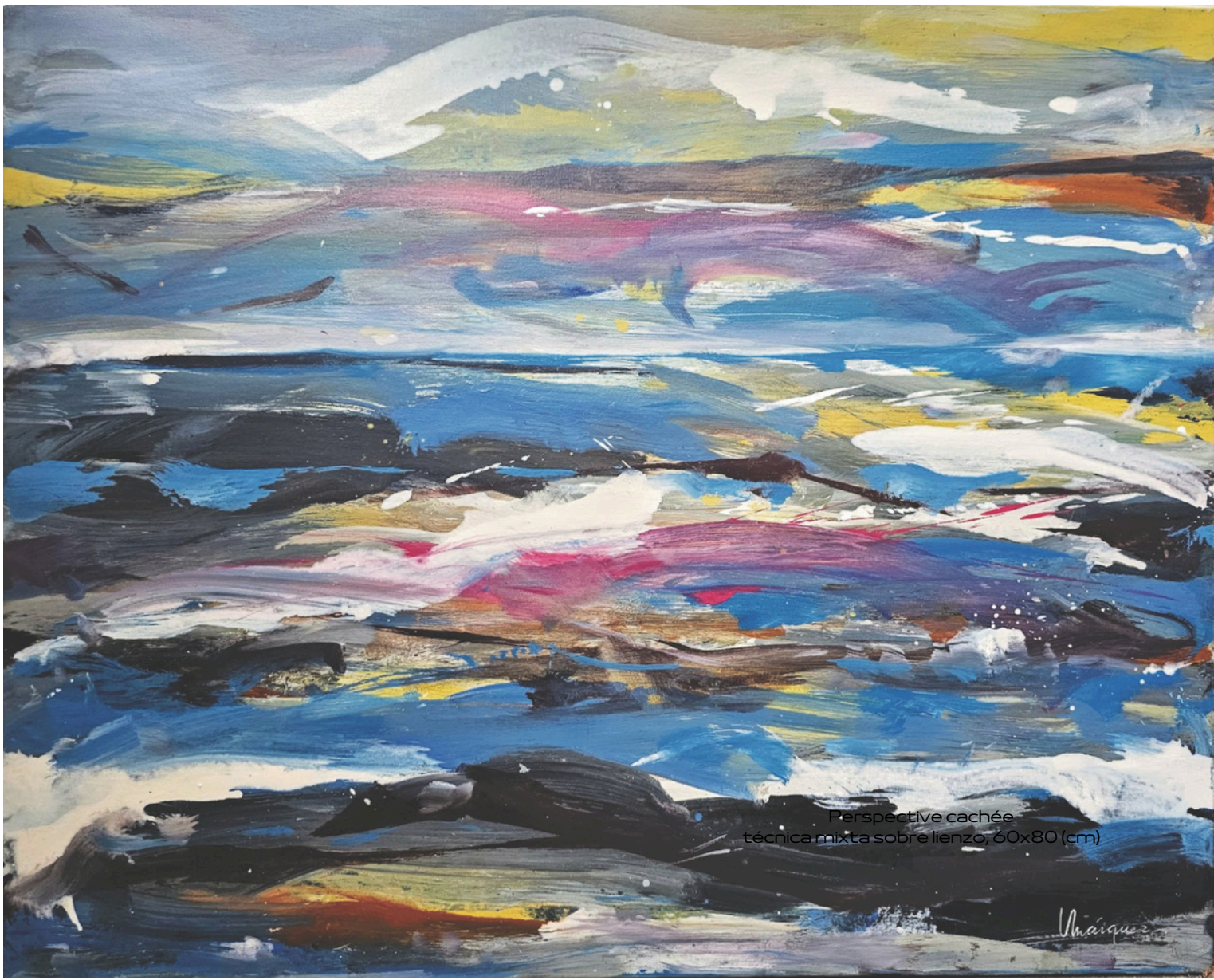
Perspective cachée técnica mixta sobre lienzo, 60x80 (cm)