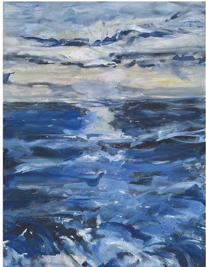
Paisaje de mar 5

Victoria Márquez. (Málaga, España) Artista Plástica Visual, pintora humanista, vinculada al "Nuevo Expresionismo"; Licenciada en Bellas Artes. Profesora Doctora de la Universidad de Málaga. Desde 1982 ha participado, a nivel nacional e internacional, en diversas Muestras, Bienales y Exposiciones Artísticas en Galerías y Museos. Su obra se encuentra presente en diversas Instituciones y Museo nacionales e internacionales.