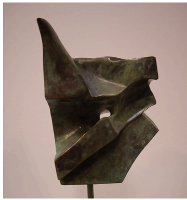
Sinfonia de la paz 1 y 2, bronce patinado, 12 x 13 x 26 cada una