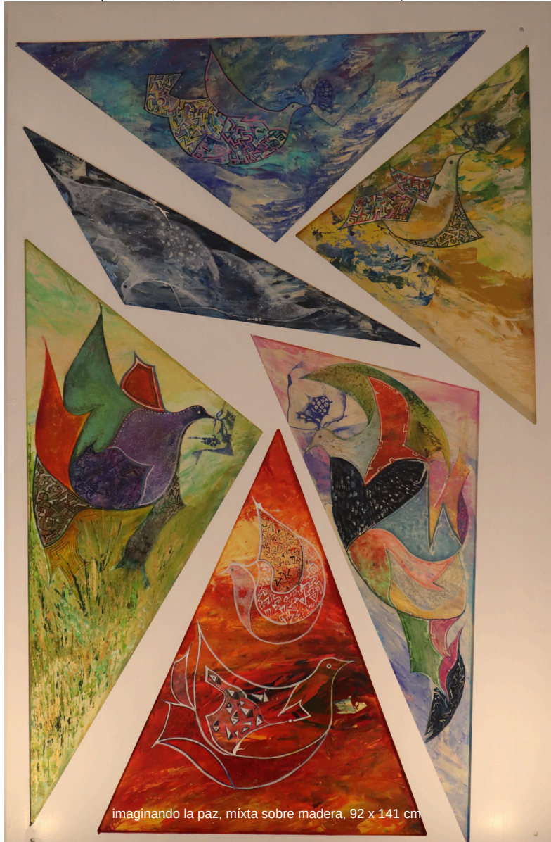
imaginando la paz, mixta sobre madera, 92 x 141 cm