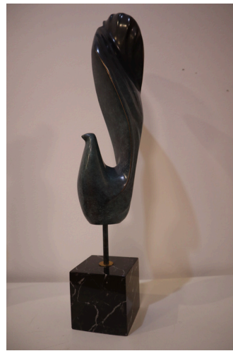
El vuelo de Urpi bronce patinado, 8 x 14 x 46 (cm)