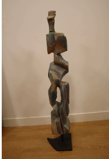
Dama de loma alta madera tallada policromada, 23 x 22x 130