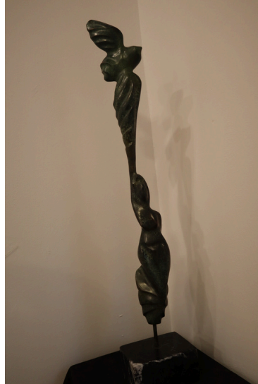
Matter pax madera tallada policromada, 22 x 22x 165