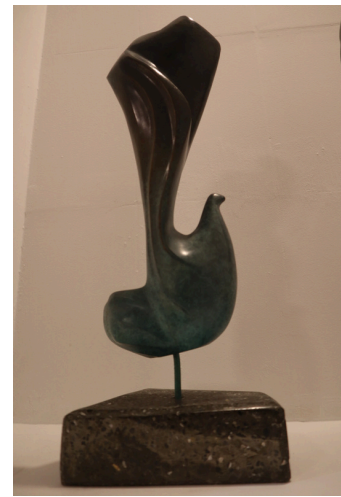
El vuelo de Merode bronce patinado, 7 x 14 x 42 (cm)