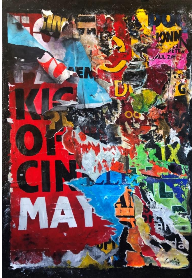
Figura 2 - Sovrapposizione II, Miguel Àngel Craviotto (2021)

Con Craviotto, el efecto de ilusión de recortes de carteles o periódicos arrancados y recombinados podemos verlo aún mejor en la obra "Sovrapposizione II", en técnica mixta sobre papel.