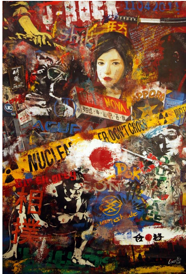
Figura 1 - Japon, Miguel Àngel Craviotto (2011)

Lo que hace interesantes sus obras desde el punto de vista visual es que, aunque todo parezca originarse de la unión material de recortes de imágenes o periódicos, en realidad son obras completamente pintadas. Los elementos que más nos sorprenden son sin duda las partes que simulan papel rasgado, o los puntos en los que las imágenes se difuminan unas en otras uniéndose sin distinción. Su trabajo está caracterizado por una ilusión pictórica que hace que la obra parezca pertenecer al mundo del arte informal -material, donde no solo se utiliza la pintura para la realización de las obras, sino también diversos materiales que se suman para dar vida a la composición final.